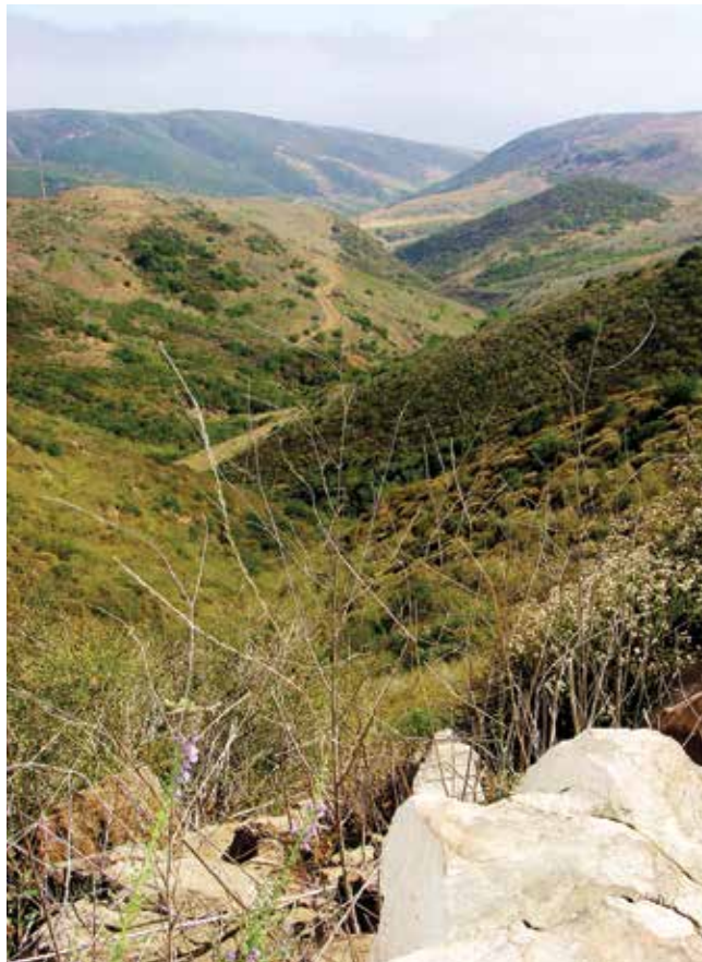
Áreas silvestre—parte del Rancho Irvine, Monumento Natural Nacional y de California

www.crystalcovealliance.org y www.thebeachcombercafe.com .